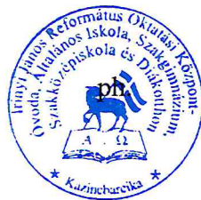
Csernaburczky Ferenc igazgató