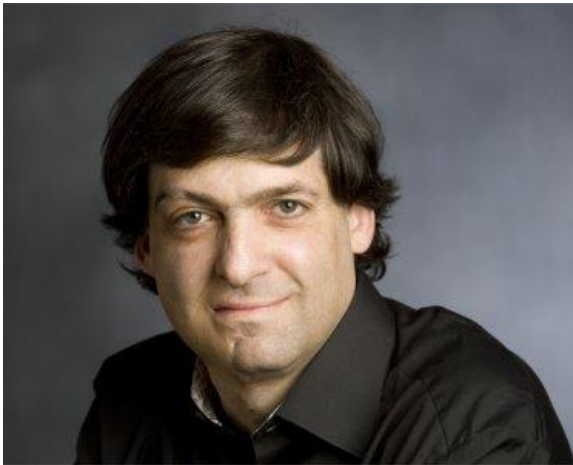
Dan Ariely (1968 - )